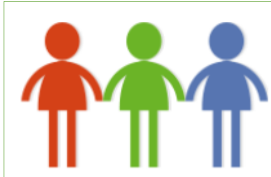
Gruppe aus Schüler:innen

Schulleitung genehmigt und überprüft im Benehmen mit Lehrkräfte-Team