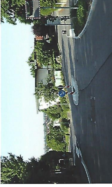
Die Verkehrsinsel in der Ziegeleistraße im Einmündungsbereich Jahnstraße bietet u. a. Schulkindern eine sichere Querungsmöglichkeit.