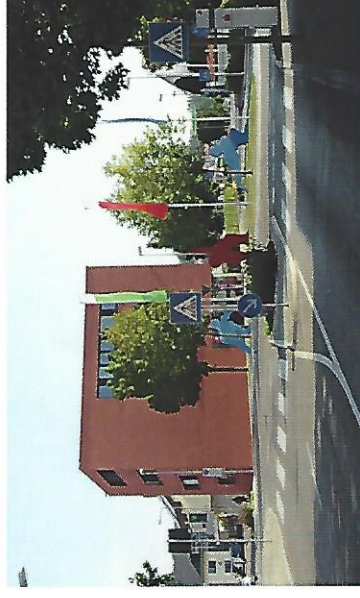
Vorsicht bei der Querung von Straßen mit hoher Verkehrsdichte wie z. B. der B 311. Zeigen Sie Ihrem Kind das richtige Verhalten am Fußgängerüberweg und seien Sie stets Vorbild.